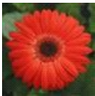
Red with Dark Eye