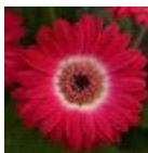
Bicolor Rose White