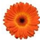
Bicolor Yellow Orange