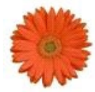
Orange with Light Eye