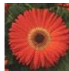
Deep Orange with Dark Eye