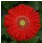
Red with Light Eye