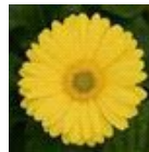
Yellow with Light Eye