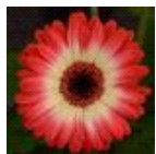
Bicolor Red Lemon