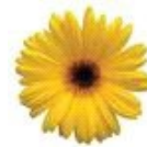
Golden Yellow with Dark Eye