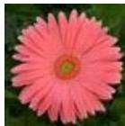
Salmon Shades with Light Eye